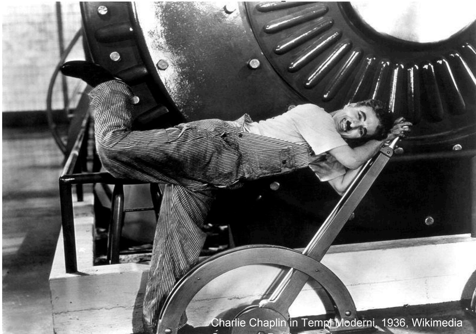
Charlie Chaplin in Tempo Moderni , 1936, Wikimedia Commons, Public Domain