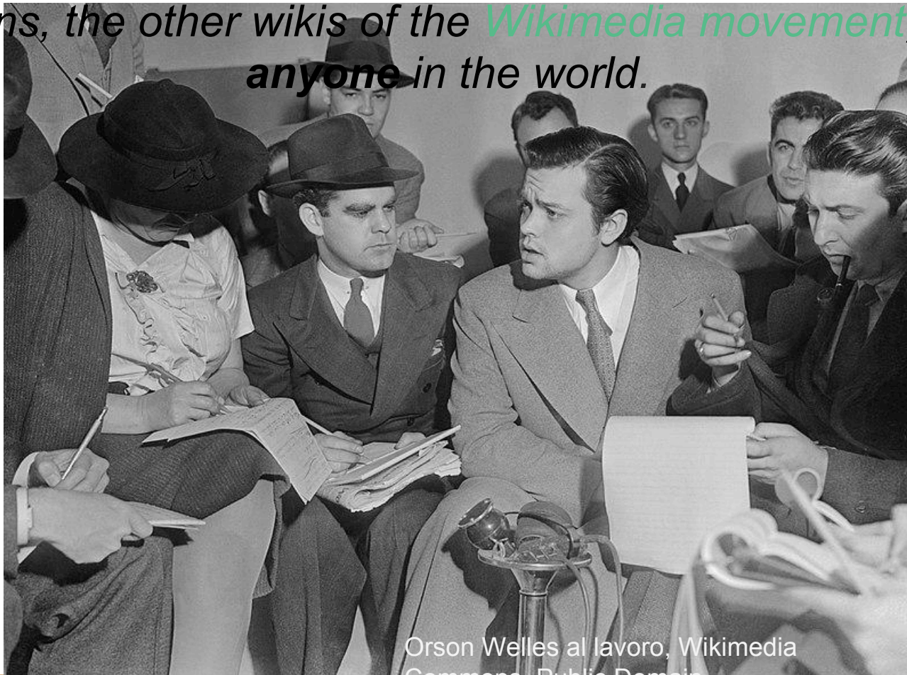
Orson Welles al lavoro

Wikidata is a free, collaborative , multilingual, secondary database, collecting structured data to provide support for Wikipedia, Wikimedia Commons, the other wikis of the Wikimedia movement , and to anyone in the world.