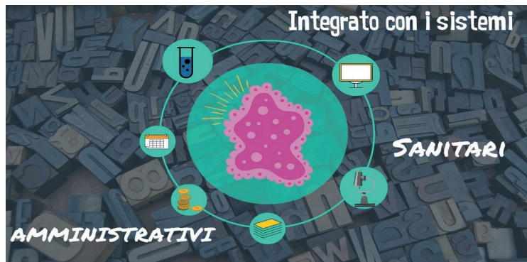
Fig. 3 Slide di presentazione del convegno

Il backoffice è completamente web based. I dati