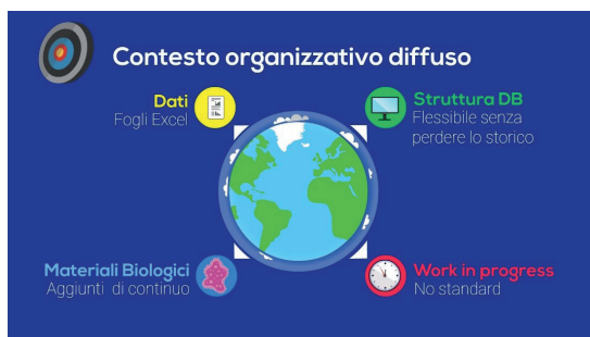
Fig. 1 Il contesto iniziale

Tra gli istituti che hanno aderito al progetto, alcuni hanno deciso di conservare la propria banca dati nel proprio data center, mentre altri isti-