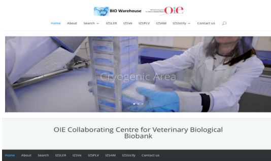
Fig. 6 Home page del sito www.biowarehouse.net

Dal 2010 è Responsabile dei Sistemi Informativi dell'Istituto Zooprofilattico Sperimentale della Lombardia e dell'EmiliaRomagna "Bruno Ubertini", con il quale ha realizzato progetti a carattere nazionale e internazionale come la rete delle biobanche, la reingegnerizzazione del sistema sanitario e il sistema distribuito per l'analisi del benessere animale.