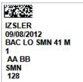
Fig. 5 Esempio di etichetta

L'obiettivo da promuovere è anche quello di creare uno schema dati omogeneo, come uno standard gestionale delle informazioni, scambiando anche le best practice sviluppate, consentendo un notevole miglioramento nello scambio delle informazioni legate alla gestione delle biobanche mondiali.